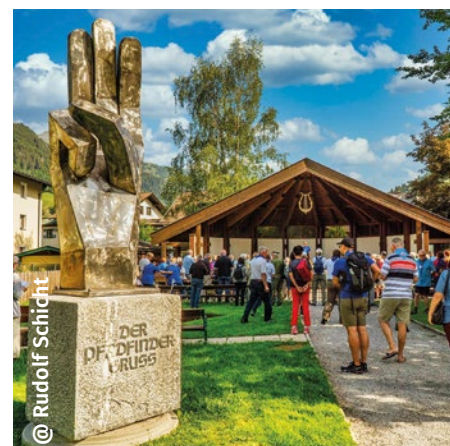
@ Rudolf Schicht