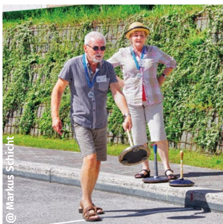
@ Markus Schicht